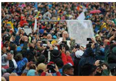
PÁPAI SZENTMISE CSÍKSOMLYÓN Százerek lelki élménye 5. o.