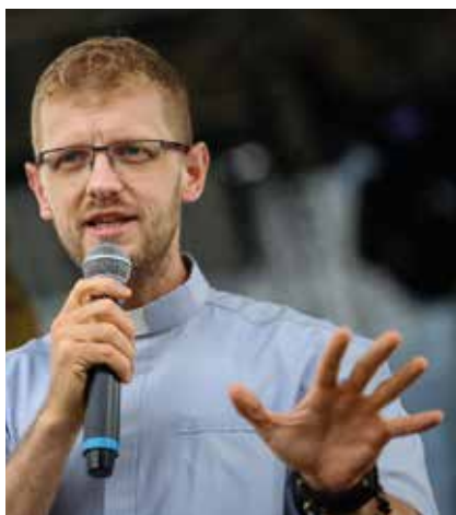
L. S. Fotó: KLING MÁRK

– Annak idején úgy kezdődött, hogy mielőtt beérkeztem a püspökségre, előbb gyógyszert kellett bevennem a püspökség ellen. Jelentem alázattal és tisztelettel, hogy azóta megváltozott a helyzet; elérkeztem a tizenötödik féle gyógyszerhez, s jól vagyok. Együttérző szeretettel gondolok utódomra, László püspök atyára, s nem hiszem, hogy kellene több gyógyszer. Rengeteg az orvosbarát, ismerős, és legközelebb van az Úristen, akivel én nap mint nap tudok találkozni. Köszönöm a szeretetet, amellyel támogattak, s így végül nem lett tragédia, sikerült a püspökséget végigcsinálni – Isten dicsőségére, Kaposvár és egész Somogy megye hasznára.