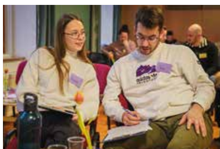
KÖZPONTI JEGYESFELKÉSZÍTÉS Népszerű a házasulandók körében 28. o.