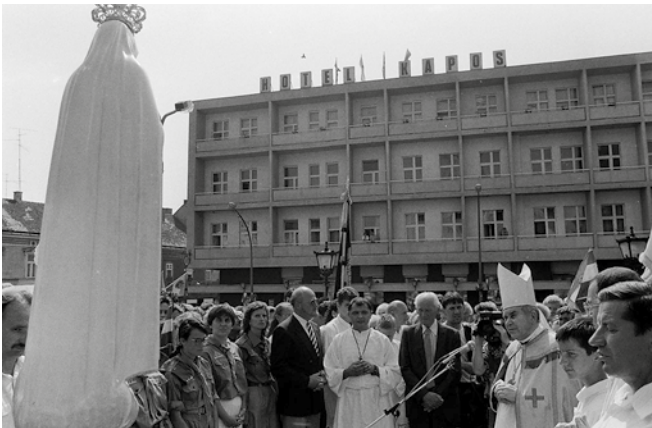
1994. július 18-án rendőri felvezetéssel a debreceni Szent Anna-templomból megérkezett a fatimai Szűzanya szobra a kaposvári székesegyházba