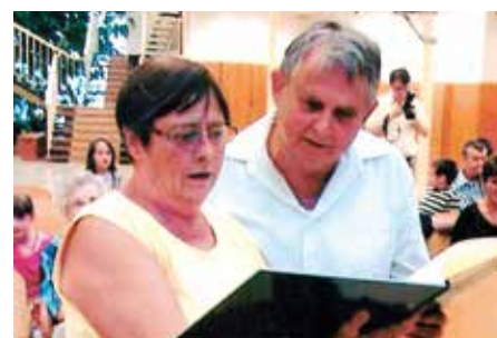
BÚCSÚ A KARDOS HÁZASPÁRTÓL A zenei élet szürkébb nélkülük 30-31. o.