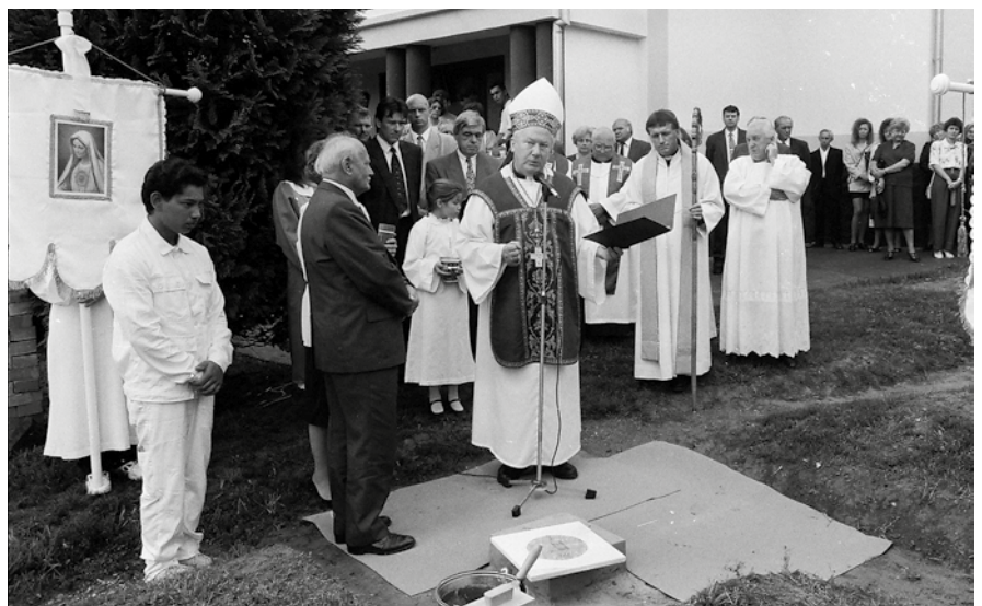
1995. szeptember 14-én Göncz Árpád köztársasági elnök jelenlétében helyezték el a sántosi templom alapkövét